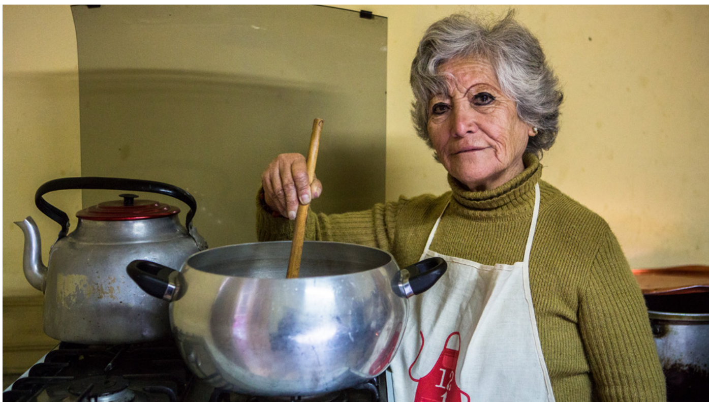
Les lieux de travail, tels que les maisons privées, rendent les femmes particulièrement vulnérables à la violence en raison de l'isolement et du manque d'accès aux mécanismes de plainte et de recours légal.

l'économie formelle (2015), qui reconnaît la nécessité de réglementer l'accès aux espaces publics et l'utilisation des ressources naturelles publiques. D'autre part, les foyers privés où les travailleurs à domicile et domestiques accomplissent leurs tâches sont considérés comme des lieux de travail à haut risque en raison de l'isolement de ces travailleurs (OIT 2016 : § 14).