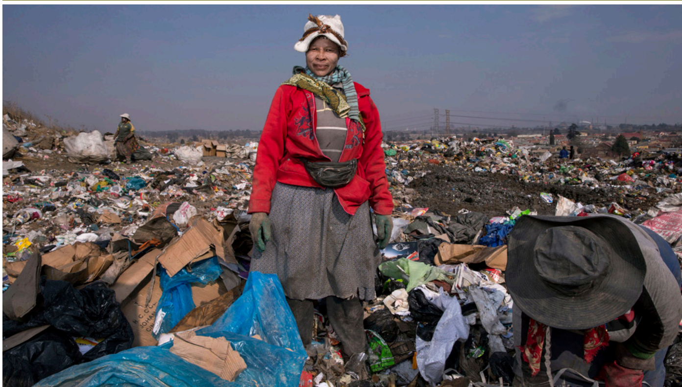
Tous les travailleurs de l'informel ont de fortes chances de subir de la violence en raison de leur statut dans l'emploi et le manque de protection, les travailleuses sont plus vulnérables à la violence sexiste en raison de la confluence de leur sexe et des conditions de travail précaires.