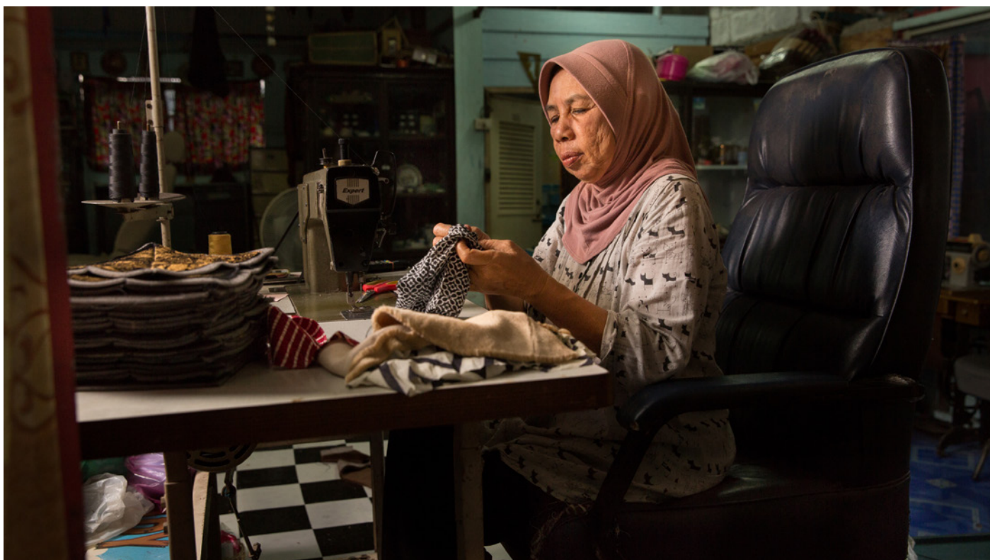
Les travailleurs à domicile sont vulnérables aux entrepreneurs qui peuvent refuser de payer un taux décent, retarder ou retenir les paiements et les soumettre à la violence psychologique.

Dans ces conditions, le renforcement et la révision des cadres juridiques et réglementaires, en vue de protéger les travailleurs de l'informel contre la violence, doit constituer un souci majeur de la norme du travail de l'OIT sur la violence et le harcèlement à l'égard des femmes et des hommes dans le monde du travail. La prévention de la violence et la protection contre celle-ci doivent prendre en compte les lieux de travail des travailleurs de l'informel, à savoir les espaces publics (rues, décharges) et les habitations privées, aux côtés des auteurs les plus fréquents d'actes de violence dans ces espaces. Cette norme doit tenir compte du fait que la protection des travailleurs sur les lieux de travail informels, c'est-à-dire la prise de mesure contre la violence au travail, doit aller au-delà de la réglementation formelle du travail. De ce fait, elle exige une approche plus globale qui s'appuie non seulement sur les ressources des inspections du travail, mais aussi celles de nombreuses entités gouvernementales, à tous les niveaux, notamment les autorités municipales qui réglementent de nombreux lieux de travail informels et les détenteurs du capital qui influencent le mode d'utilisation de l'espace public. Par ailleurs, elle doit aller au-delà du droit du travail pour incorporer d'autres domaines du droit (par exemple, le droit administratif et les règlements municipaux) qui peuvent plus facilement offrir une protection juridique aux travailleurs de l'informel.