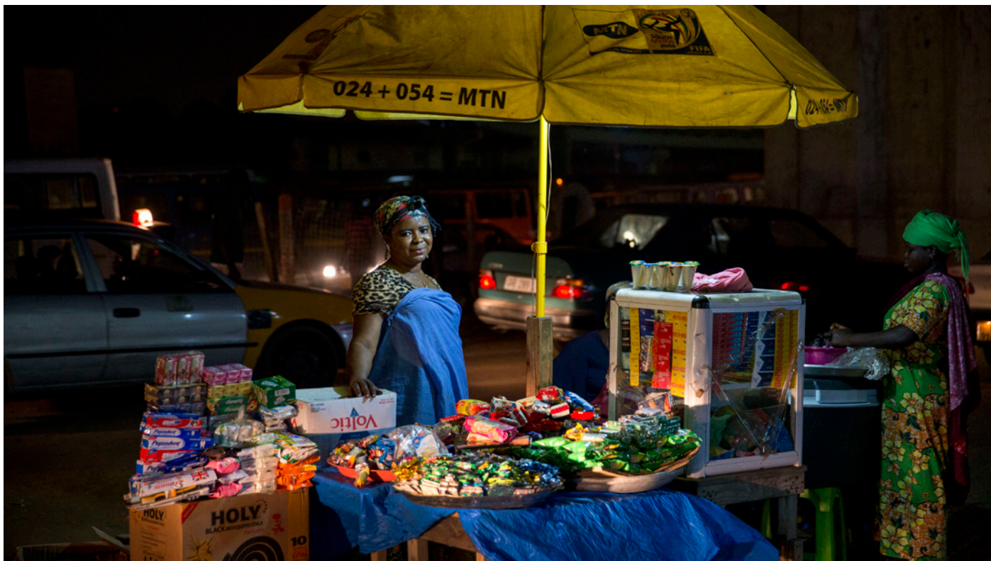
La violence liée au travail peut provenir d'un certain nombre de sources, notamment: l'État, les collègues, les membres du ménage, le public ou les usagers du service fourni, les acteurs criminels et les puissants intérêts acquis.

Un recours légal en dehors de la relation de travail standard est nécessaire : Les travailleurs de l'informel signalent une exposition généralisée à la violence et au harcèlement, mais ne peuvent accéder aux mécanismes de règlement des différends ni bénéficier d'inspections du travail. Renforcer les cadres réglementaires pour prévenir la violence sexiste dans le monde du travail suppose donc qu'il faudra renforcer l'accès des femmes à la justice en cas de violence physique, sexuelle et psychologique aux mains des agents de l'État, des acteurs criminels, des employeurs, des membres du ménage et des consommateurs.